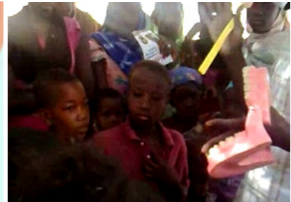
Propos recueillis par Oumar KANE à Tékane, le 19 avril 2014

Regardez la vidéo : Regardez la vidéo : http://youtu.be/-b7AXbahg